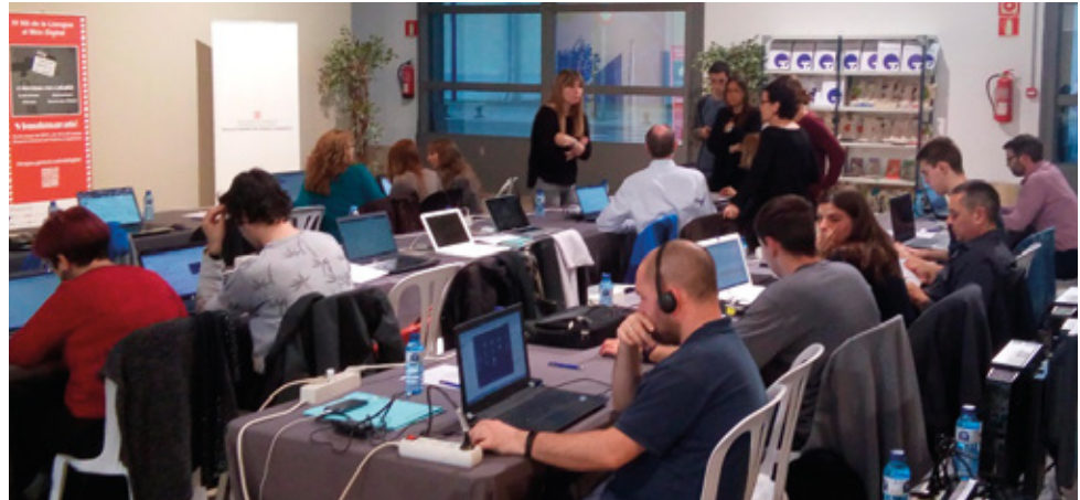
Viquimarató de la Nit Digital 2017 a Tarragona

Una de les iniciatives més destacades de refinament qualitatiu és la categorització en articles bons i de qualitat. Aquests articles segueixen amb cura el llibre d'estil i tenen referències solvents per a cada peça d'informació possible; es considera que cobreixen a la perfecció un tema concret. Qualsevol usuari pot proposar-ne la distinció, i a través de dues fases (avaluació i votació) un grup de viquipedistes en valora la idoneïtat. Aquest grup selecte d'entrades, unides a altres marca-